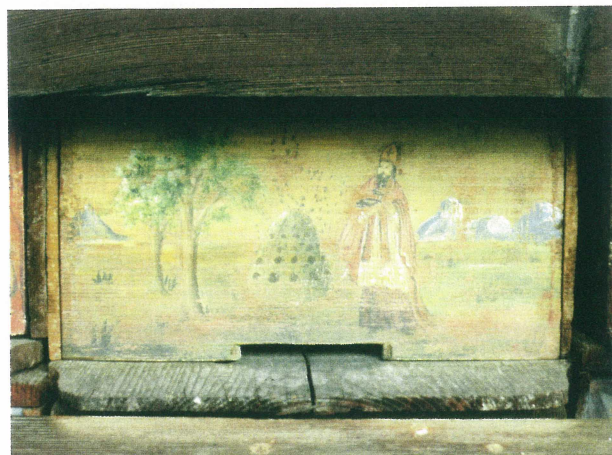
Sv. Ambrož na panjski končnici v Janševem čebelnjaku