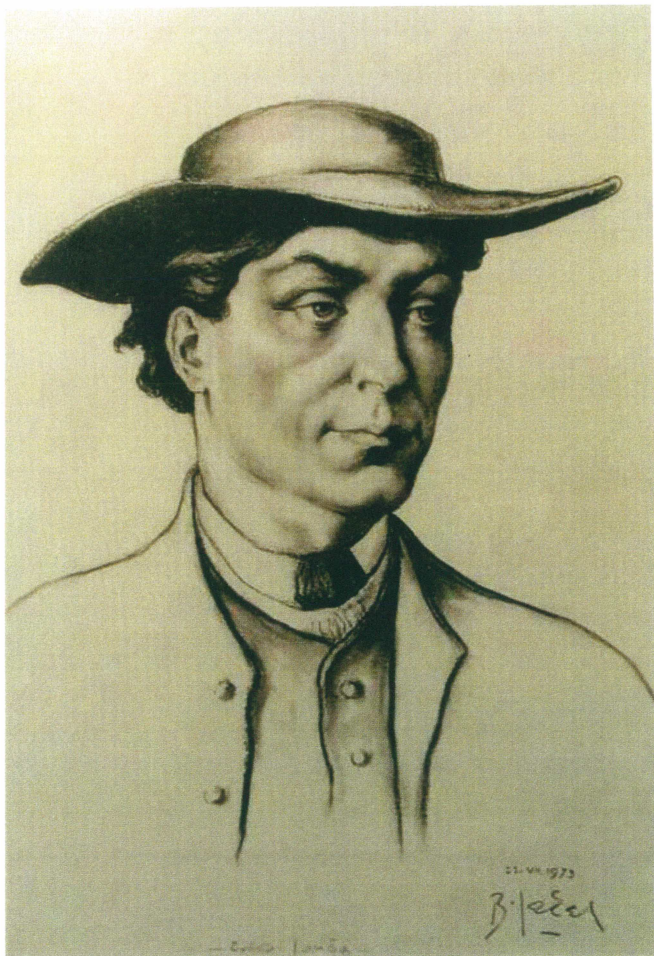
Božidar Jakac: Anton Janša (Objava v Čebelarskem terminološkem slovarju, 2009)

Janša je spomladi leta 1770 za učne namene, da bi poslušalcem lahko pokazal praktično rokovanje pri čebelarjenju, sam nabavil 16 panjev. Leta 1771 je imel v šolskem čebelnjaku že 66 panjev in v letu 1772 okoli 300 panjev. V zapuščinskem zapisniku po Janševi smrti je zapisano, da je Janša zapustil 194 panjev. Kakor je bilo že zapisano, naj bi 16 lesenih kranjskih panjev s čebelami pripeljal s seboj od doma z Breznice. Kranjske čebele z Gorenjskega naj bi bile potemtakem na čebelarski šoli v Augartnu.