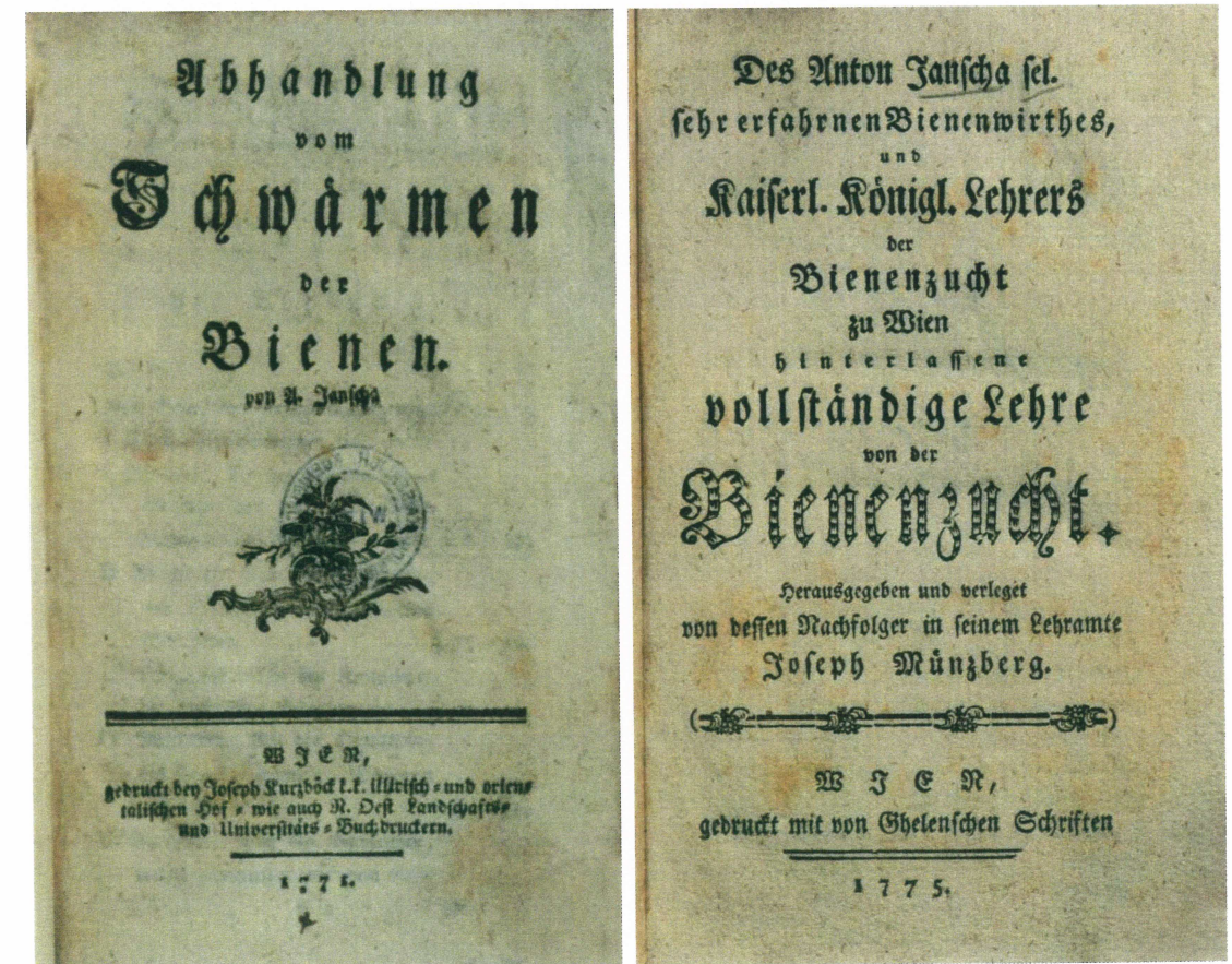
Janševi knjigi sta uvrščeni med pomembnejše knjige klasičnega svetovnega čebelarskega slovstva