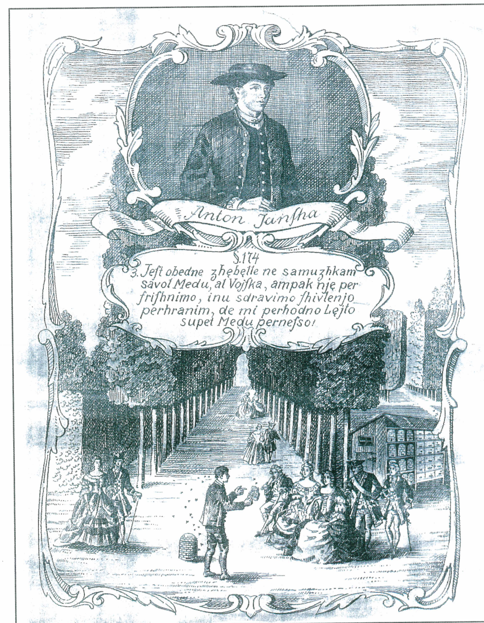
Janša poučuje čebelarstvo v Augartnu

Leta 1773 je Janša izdelal načrt in predlog za čebelarško družbo, kar pa ni bilo sprejeto. Prosil je tudi za pomočnika, a prošnja je bila rešena po njegovi smrti. Janša je umrl 13. septembra 1773 za posledicami vročinske bolezni in je pokopan na pokopališču fare Sv. Leopolda v Augartnu.