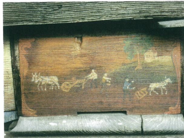
Delo na polju; panjska končnica v Janševem čebelnjaku

Janšev čebelarški nauk je našel svoje mesto tudi v čebelarškem patentu, ki ga je 8. aprila 1775 zaukazala Marija Terezija. V dodani odredbi: Instrukcija za čebelarške mojstre je v drugi točki zapisana zahteva, da se pri naročilu čebelnjakov s potrebnimi panji upoštevajo preizkušena načela prvega dunajskega čebelarškega učitelja Janše.