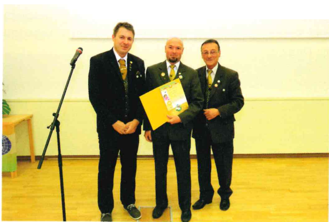
Častno priznanje ČZS