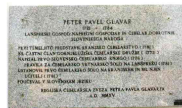
Spominska plošča Petru Pavlu Glavarju na Lanšprežu