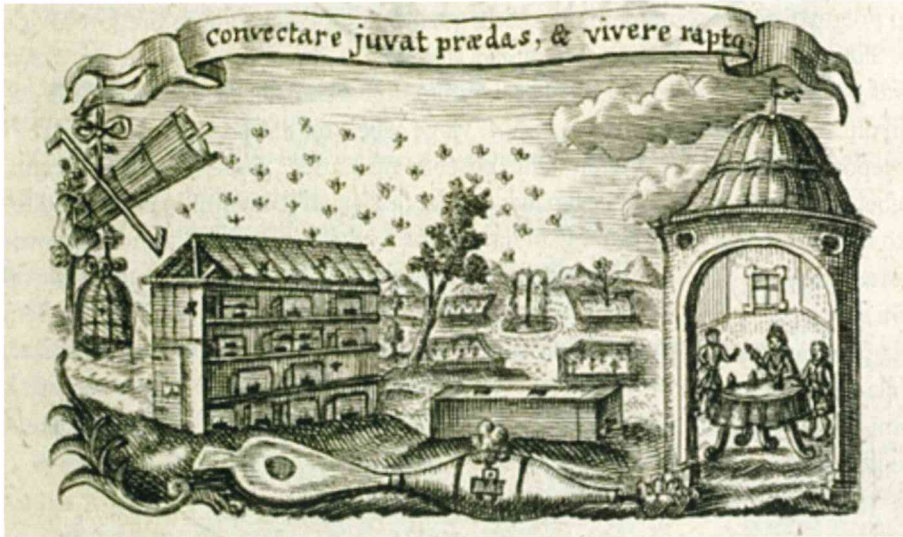
Bakrorez na naslovnici Kratzerjeve knjige (1774) z napisom Convectare iuvat praedes et vivere raptio . Uživajo v nabiranju in živijo od nabranega