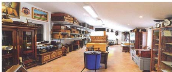
Cebelarski muzej (Anton Koželj)

Njihovo zadovoljstvo in optimizem je zagotovo najboljša promocija in zagotovilo pri ohranjanju tega pomembnega dela slovenske naravne in kulturne dediščine.