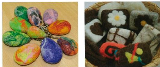
Drobni izdelki iz volnena filca (Boris Grabrijan)