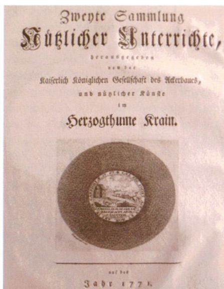
Naslovnica druge knjige »Zbirka koristnih nasvetov«

Kranjska kmetijska družba (ob ustanovitvi leta 1767 imenovana Družba za poljedelstvo in koristne spretnosti na Kranjskem) je v nemškem jeziku v letih 1770-1779 v Ljubljani izdala štiri obsežne knjige »SAMMLUNG NÜTZLICHER UNTERRICHTE« (Zbirka koristnih nasvetov), kjer so objavljali poučne spise, nasvete in poskuse.