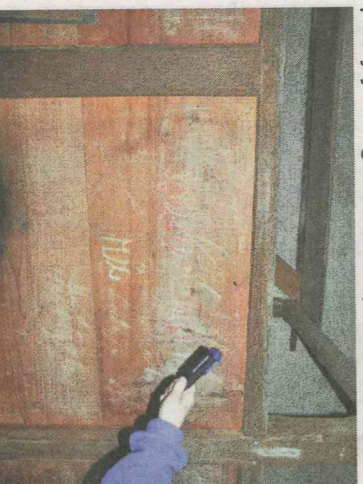
Knjigovodstvo na predalu

vsak prostor ima svoj vhod. V enem je danes vinska klet, v drugem shramba za različne stvari. V kašči je deset velikih predalov in skrinja. Sprednje strani predalov so zgovorno knjigovodstvo. Na njih so zapisane vrste žita, ki so bile tu shranjene, namembnost žita (za seme ali za hrano) in količina žita v mernih. Tudi ganek je služil shranjevanju živil. Pod stropom so ranke za sušenje mesnin, ob vhodu pa zanimiva kamnita posoda za mast. V zadnjem času pa je ganek dobil povsem novo poslanstvo. Odkrili so ga organizatorji porok in nanj se prihajajo fotografirati mladoporočenci.