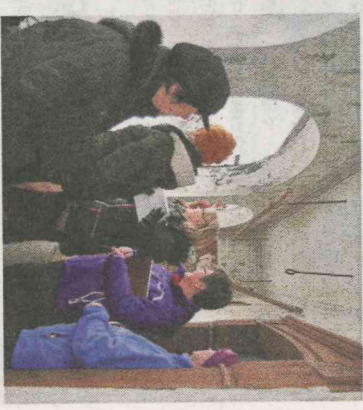
Tukaj se razgledujejo mladoporočenci

Razumljivo je, da je tako velika kašča potrebna samo veliki kmetiji. Poleg velikih površin svoje zemlje Medvedovi obdelujejo še najeto, saj imajo v najemu svojo nekdanjo zemljo, ki je bila po 2. svetovni vojni nacionalizirana. V Šentpavlu je še nekaj velikih kmetij. Domnevno so nastajale ob koncu 18. in v začetku 19. stoletja. Parcele gospostva bližnje graščine Grumlof je tedaj po zmernih cenah prodajal verski sklad. Ko je cesar Jožef II. razpustil samostane, je bil Grumlof namreč v lasti kostanjeviškega samostana.