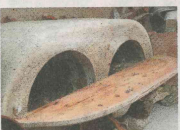
Posoda za mast