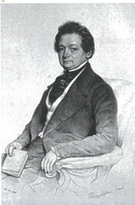
Franz Xaver von Hlubek https://de.wikipedia.org/wiki/Franz_Xaver_von_Hlubek

1852 – 1867 – urednik revije Wochenblatt der k. k. steiermärkischen Landwirtschafts-gesellschaft