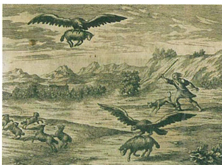
Čast in slava vojvodine Kranjske. Ljubljana, 2009, III/444