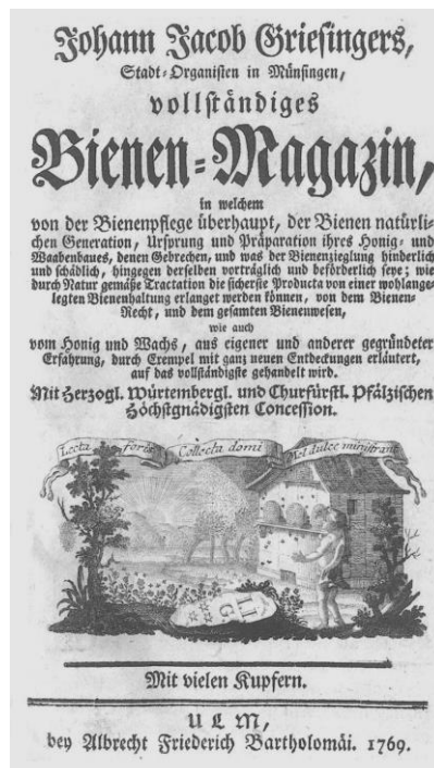
Naslovnica knjige - Griesingers 1769