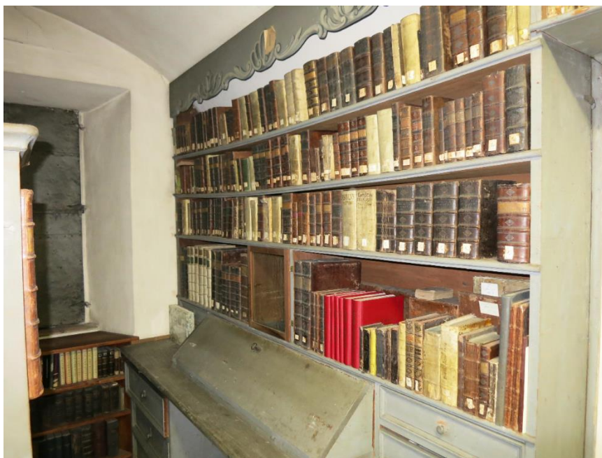
Glavarjeva knjižnica v Komendi

V beneficijski hiši v Komendi, ki je bila dograjena leta 1752, je bila tudi z železnimi vrati in polknicami ter z obokanim stropom skrbno zavarovana soba v izmeri 7 x 3 m namenjena knjižnici. Poleg ohranjenih Glavarjevih knjig je tu tudi Arhiv Glavarjevega beneficija, ki ga je skrbno uredil mag. Baraga (1998). Sezname knjig so shranjeni v 23. fasciklu. Knjižnična predsoba velikosti 7 x 5 m je danes urejena kot spominska soba. Ob Glavarjevi selitvi na Lanšprež (1766) je zelo verjetno vzel s seboj tudi nekatere knjige, med njimi gotovo tudi čebelarske, ki pa so se porazgubile in niso bile vrnjene na svoje mesto v Glavarjevi knjižnici.