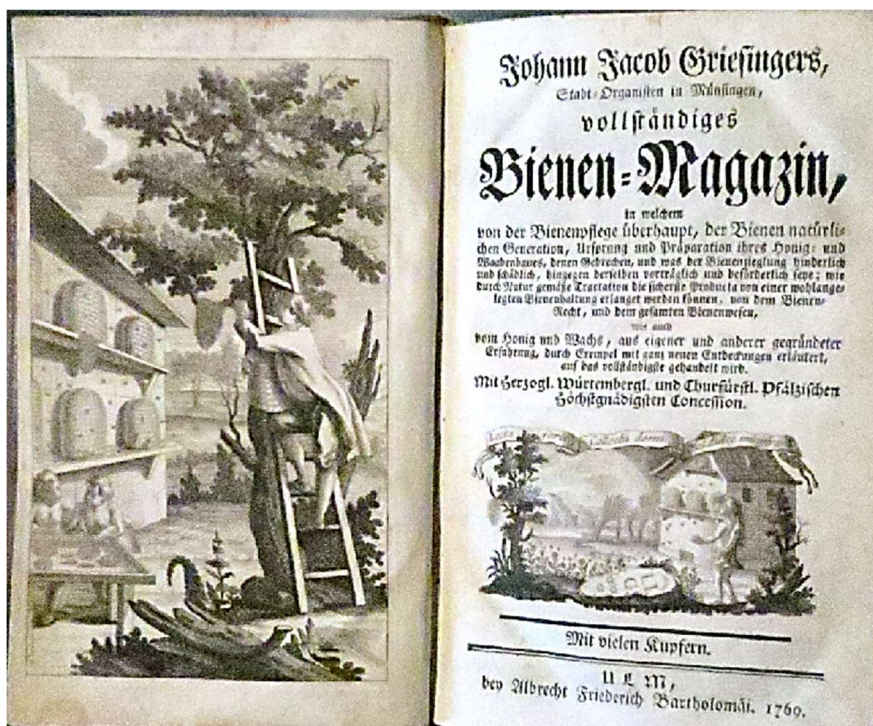
Naslovnica knjige - Griesingers 1769

Glavar je v teh knjigah našel koristnega pomočnika pri pisanju »Odgovora« (1768) in osnutka svoje čebelarke knjige (1771) ter skupaj z Janševo knjigo Razprava o rojenju čebel pri Pogovoru o čebelnih rojih v letu 1776.